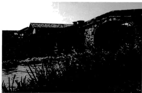
Cascina Conca ed il Ponte Gobbo

La pianta è basilicale a tre navate, con volte rette da archi a sesto acuto che poggiano su pilastri cilindrici. Sulla crociera poggia un piccolo tiburio ottagonale. All'interno sono custodite alcune opere molto importanti. Lasciando Morimondo e superato l'incrocio con la S.S. 526 e la cappellina della Madonna di Lourdes, il percorso riprende a costeggiare il Naviglio di Bereguardo, con le sue "conche", utili per far prendere velocità all'acqua, e le innumerevoli diramazioni di fossi per l'irrigazione dei campi in estate.