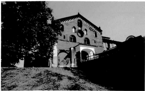
Abbazia di Morimondo

Il miracolo accade subito dopo quando, risalendo dai campi, si arriva al monastero. Può succedere di sentirsi trasportati otto-dieci secoli all'indietro nel tempo. Due arconi introducono nel suggestivo piazzale, dominato da un fianco della Chiesa abbaziale costruita fra il 1182 ed il 1292. Il suo stile può essere definito un adattamento del gotico borgognone ai modi lombardi. La facciata, tagliata a capanna, è a vela (più alta, cioè, del tetto principale, con bell'effetto d'apertura verso il cielo).