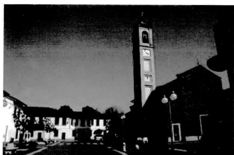
Parrocchiale di Bubbiano e Municipio

Situato al limite estremo dell'alto pavese (22 Km. da Pavia e 25 Km. da Milano), questo paese vanta antiche origini che risalgono al periodo delle guerre signorili e comunali. La nascita di Casorate viene fatta risalire al 997, anche se fino al V-VI secolo non si hanno conferme scritte del villaggio. Nel 1239, avvenne la sanguinosa battaglia fra i Milanesi a capo di una seconda Lega Lombarda e l'imperatore Federico II, che dovette ripiegare verso Pavia dopo la sconfitta. Col