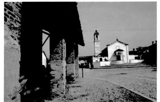
Parrocchiale di Fallavecchia