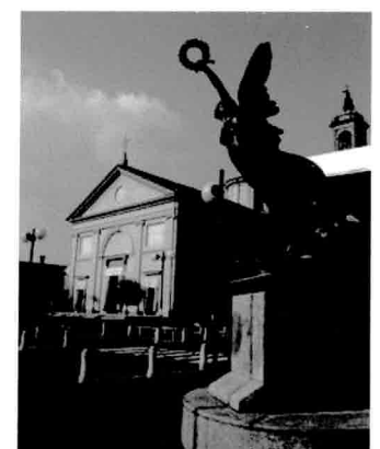
Monumento ai Caduti. Piazza Contardi

passare degli anni molti furono i mutamenti di questo paese. Nel 1757 Casorate fu assegnato alla II a Delegazione del Principato di Pavia; nel 1800 Casorate fu denominato sotto il nome di Casorate Primo allo scopo di evitare confusione con il comune di Casorate in provincia di Varese (oggi conosciuto come Casorate Sempione); il XX fu un secolo di grossi cambiamenti, dal punto di vista politico, economico e sociale.