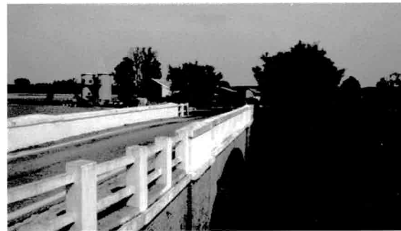
Cascina Dell'Acqua ed il ponte sul Naviglio di Bereguardo

Per l'80% la manifestazione si svolge su strade sterrate. Il percorso si snoda a cavallo fra la provincia di Pavia e quella di Milano. I temi predominanti degli itinerari sono i campi, i boschi ed il digradare del terreno verso il Ticino. Un paesaggio che, se in estate è immerso nel verde, anche nella stagione invernale conserva tutto il suo fascino, con i campi imbiancati dalle brinate e gli alberi (spogli) con i rami che sembrano di cristallo, per effetto delle gelate notturne. S'incontrano cascine storiche e tradizionali, ma anche modernamente volte in chiave ecologica,