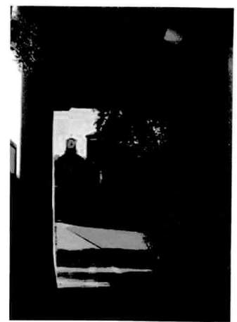
Arconi e Piazzale dell'Abbazia

Il miracolo accade subito dopo quando, risalendo dai campi, si arriva al monastero. Può succedere di sentirsi trasportati otto-dieci secoli all'indietro nel tempo. Due arconi introducono nel suggestivo piazzale, dominato da un fianco della Chiesa abbaziale costruita fra il 1182 ed il 1292. Il suo stile può essere definito un adattamento del gotico borgognone ai modi lombardi. La facciata, tagliata a capanna, è a vela (più alta, cioè, del tetto principale, con bell'effetto d'apertura verso il cielo).