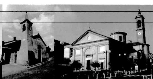
Chiesetta di Sant'Antonio