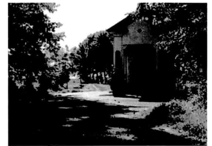
Cappella del Lazzaretto di Casorate Primo

Uscendo dal parco si giunge a Morimondo. Il paese che s'intravede giungendo dal bosco sembra a prima vista non troppo differente dagli altri del basso milanese.