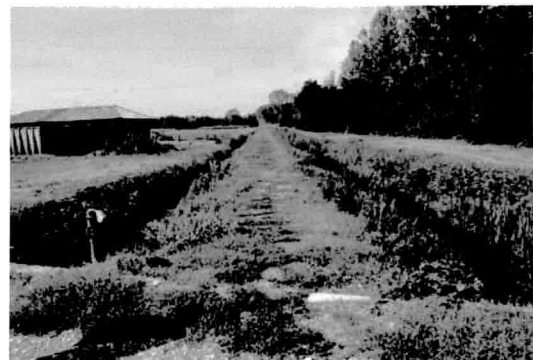
Rogge e fossi della Valle del Ticino

ancora oggi ne porta il nome, ed in quel tempo era al di là del bastione e del fossato a nord dell'abitato (Borgo) chiuso e custodito da guardie. Oltrepassato questo luogo di memoria, s'incontra Cascina Dell'Acqua, tipica costruzione rurale ai confini del basso milanese e dell'alto pavese (con vendita diretta di riso) e l'antico ponte per il primo attraversamento del Naviglio di Bereguardo.