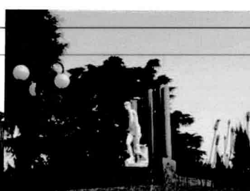
Monumento "Martiri della Liberazione"