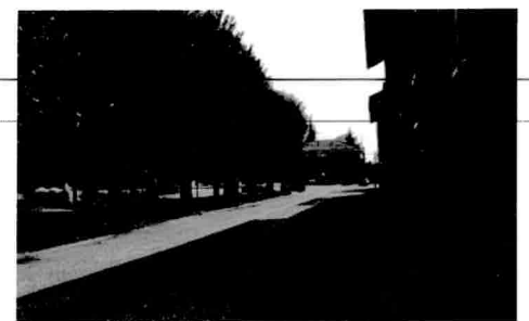
Il centro abitato di Fallavecchia